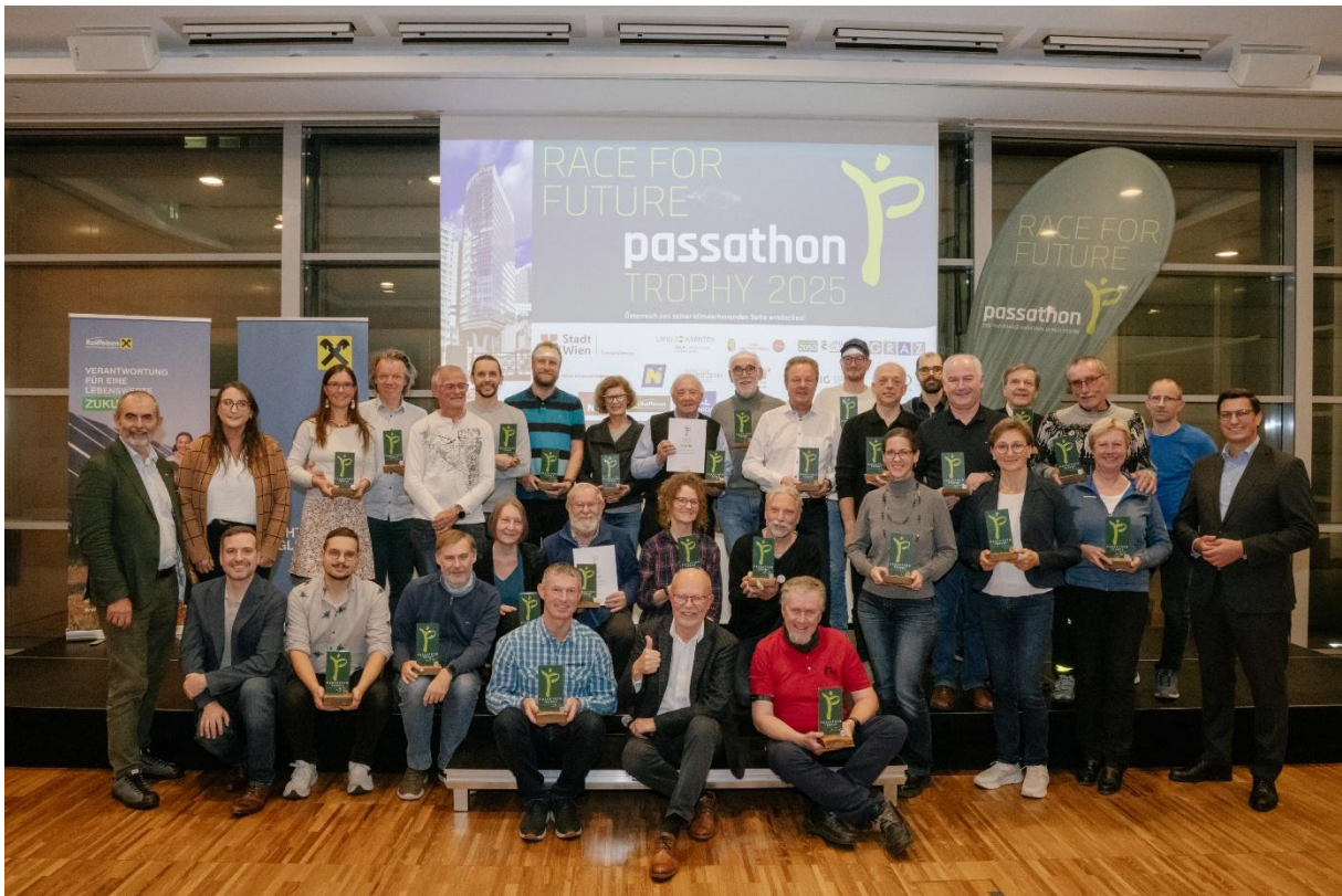
Bild 1: Große Siegerehrung aller passathon 2025 TROPHY Platin, Gold und Silber; Fotocredits: Luiza Puui