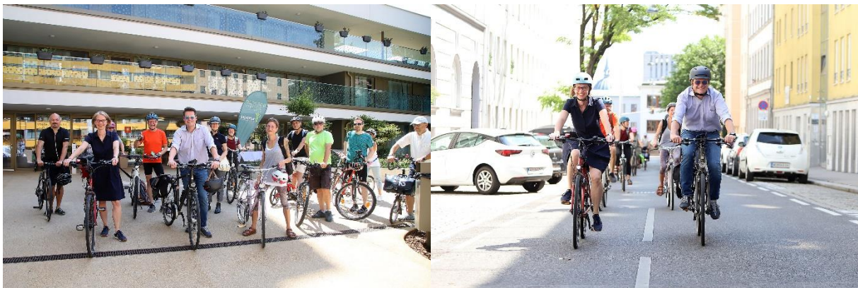
Bild 1: Die Fahrradgruppe vor dem passathon-Leuchtturm Pensionistenheim Penzing. 1. Reihe v.l.n.r.: Bezirksvorsteherin 14. Michaela Schüchner, Klimastadtrat Jürgen Czernohorszky und BV-Stv. 15. Merja Biedermann; Bild 2: Bezirksvorsteherin 14. Michaela Schüchner und Klimastadtrat Jürgen Czernohorszky am Fahrrad unterwegs zum nächsten passathon-Leuchtturm, Quelle: © PID/Votava

In Wien können beim passathon – RACE FOR FUTURE 89 der klimaschonendsten Gebäude ganz klimaneutral mit dem Rad erkundet werden. Vom Parlament über das Hauptgebäude des ORF zum Pensionistenheim Penzing oder das Boutiquehotel Stadthalle erstrecken sich die Routen. Auch viele Wohnbauten sind beim weltweit größten Outdoor-Event für klimagerechtes Bauen und Sanieren zu entdecken. Mit der Handy-App wird man direkt zu diesen herausragenden Leuchttürmen hingeleitet und erfährt alle wesentlichen Informationen zu diesen Objekten vor Ort. Unter dem Motto "Gut für deine Gesundheit! Gut für unser Klima!" wird auf sportliche Weise die Architektur-Vielfalt dieser zukunftsweisenden und enkeltauglichen Bauten erlebbar.