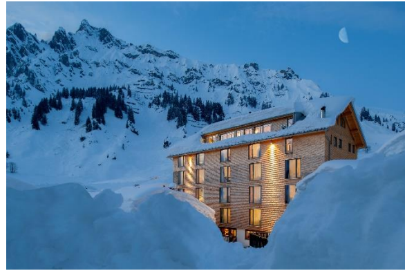
Bild 1+2: 2021 sind 190 weitere Leuchttürme ins Programm aufgenommen worden, wie die 1. Plusenergie-Wohnanlage von Wiener Wohnen und das Hotel Mondschein