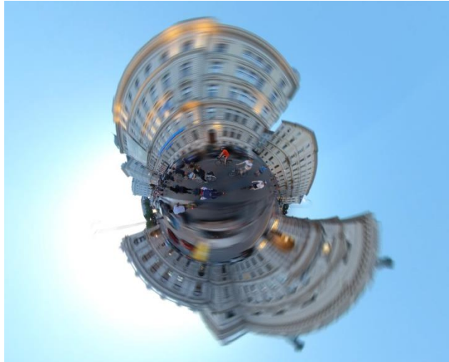
Bild 1 + 2: RACE FOR FUTURE heißt es, wenn sich beim vienna passathon 2019 alles um 28 Leuchtturmobjekte dreht. Hier erste spektakuläre Videoaufnahmen vom letzten Friday Nightskating vor dem vienna passathon